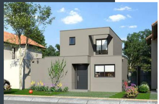
Casa B • Mediterránea • 88 m 2 aprox.