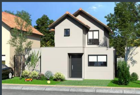
Casa A • Chilena • 88 m 2 aprox.