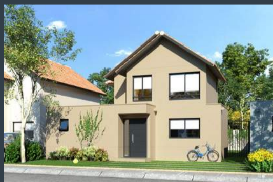
Casa D • Chilena • 103 m 2 aprox.