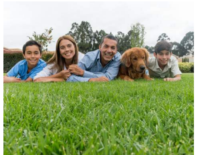
AMPLIOS PATIOS XL (UNIDADES LIMITADAS*).