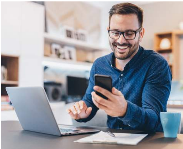
ESPACIO PARA COMBINAR HOME OFFICE CON ESTAR FAMILIAR.

La tranquilidad que buscas para tu vida familiar la encuentras en Condominio Los Arrayanes .