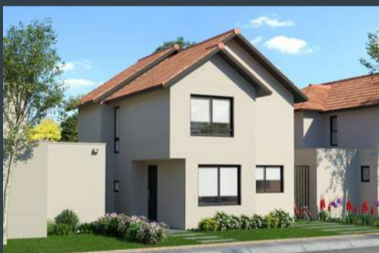
Casa C • Chilena • 98 m 2 aprox.