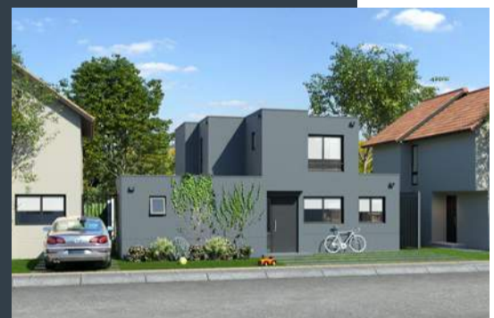
Casa E • Mediterránea • 112 m 2 aprox.